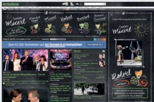
Kreativer Einsatz von Onlinewerbung: MediaCom – die Kommunikationsagentur GmbH | Coca-Cola GmbH