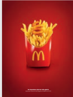
Handel, Konsum- und Luxusgüter: DDB Wien | McDonald's Österreich