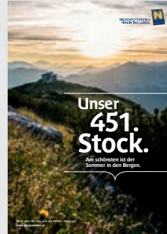
Dienstleistungen: We Make GmbH | Niederösterreich Werbung GmbH