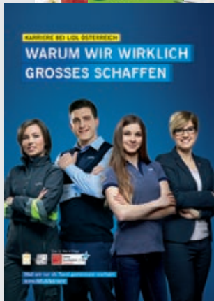
Printwerber des Jahres: Lidl Österreich GmbH