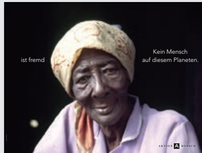
Social Advertising: GGK Mullenlowe | Aktion Mensch e.V.