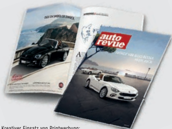
Kreativer Einsatz von Printwerbung: Leo Burnett | FCA Austria GmbH